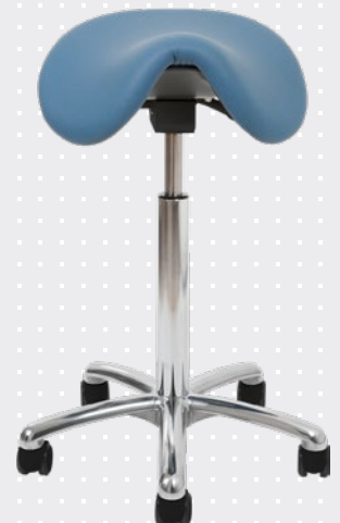
VELA Samba 400