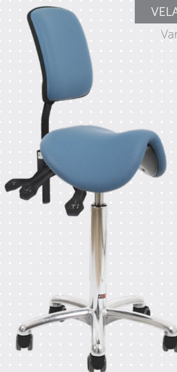
VELA Samba 420