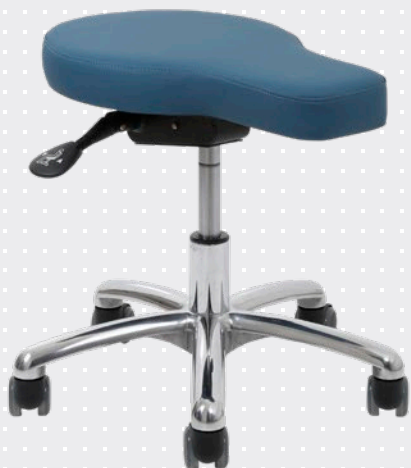
VELA Samba 530