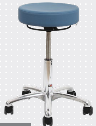
VELA Samba 500