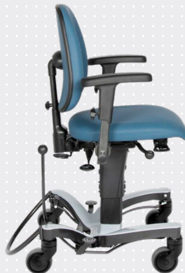
VELA 'Large' Træningsstol

Et bredt og højt ryglæn samt et dybt og bredt sæde, giver ekstra støtte og support.