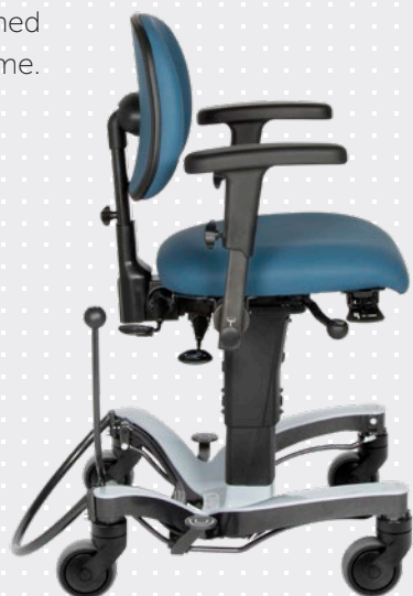
VELA 'Medium' Træningsstol

Et lille ryglæn, støtter optimalt i lænden og giver fri bevægelighed i ryg, skuldre og arme.