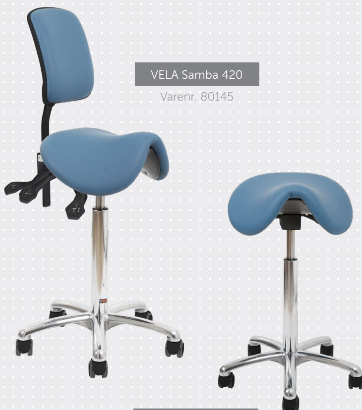
VELA Samba 400