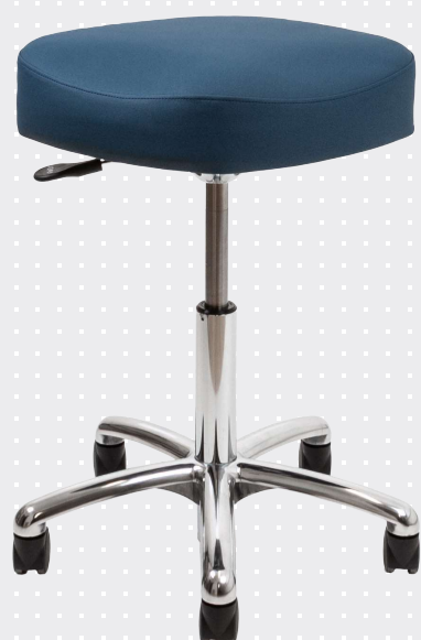
VELA Samba 410