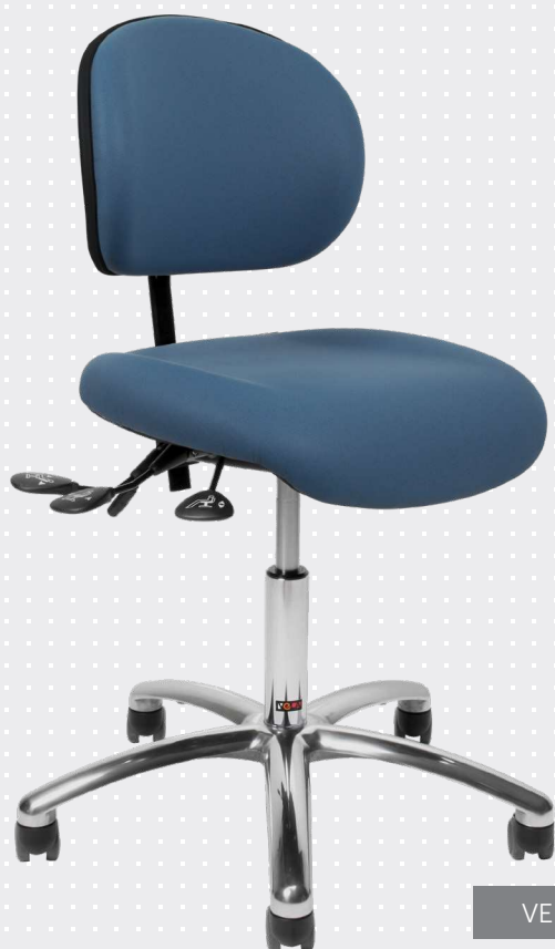
VELA Latin 100