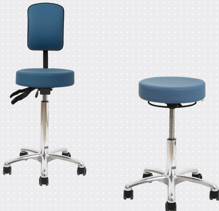
VELA Samba 500