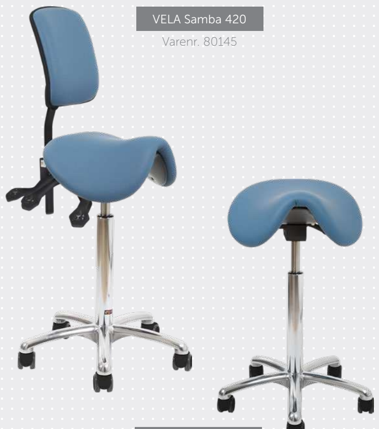
VELA Samba 420