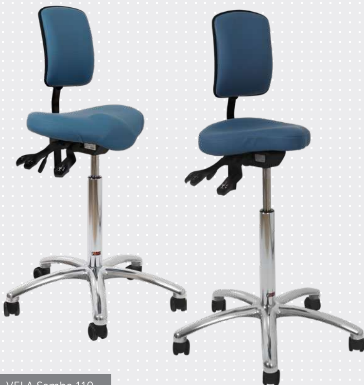
VELA Samba 110