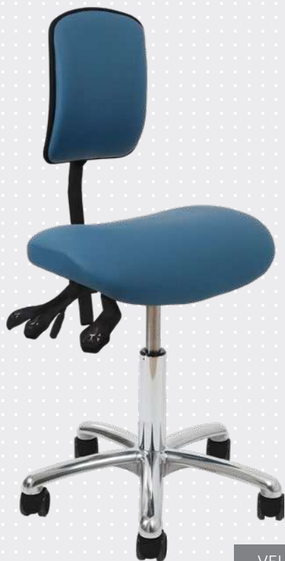
VELA Samba 150