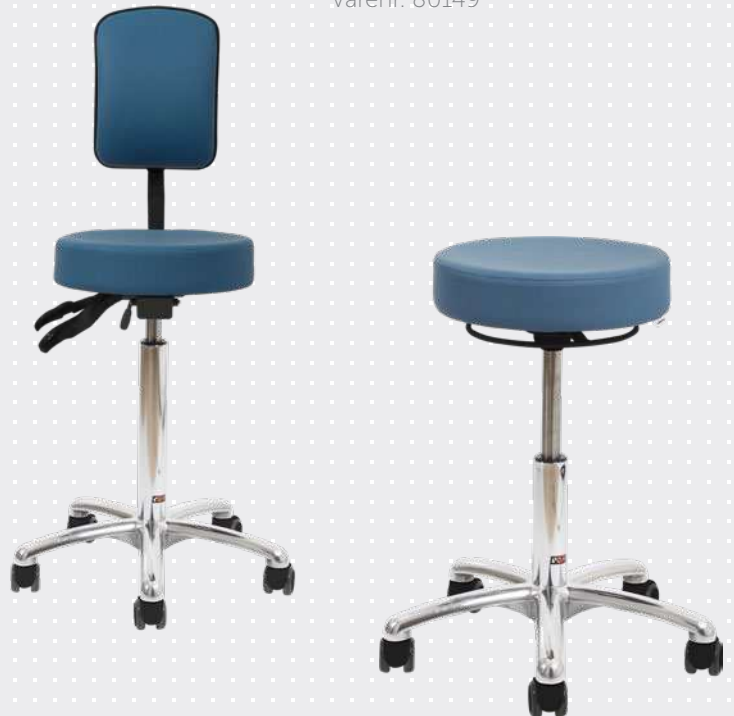
VELA Samba 500