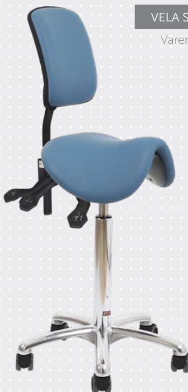
VELA Samba 420