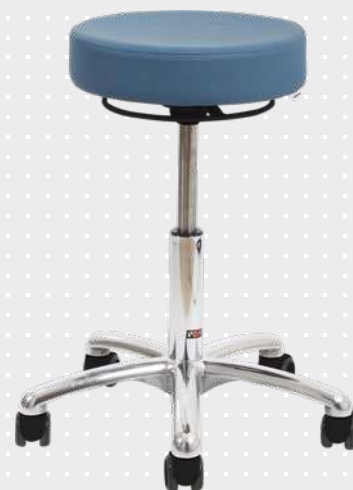
VELA Samba 500