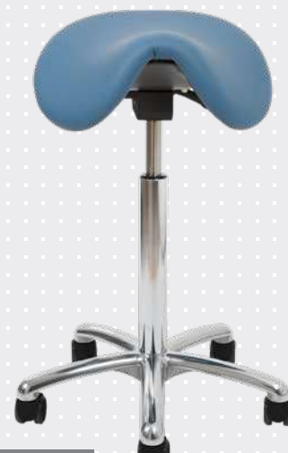
VELA Samba 400