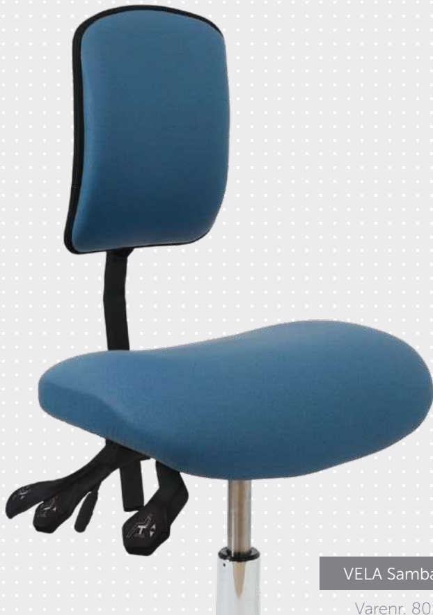
VELA Samba 150