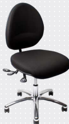
VELA Latin 200