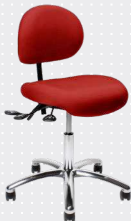
VELA Latin 100