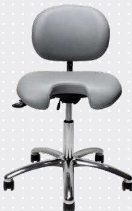
VELA Latin 300